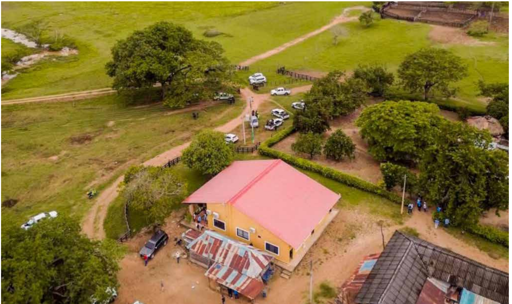
Hacienda La América fue entregada a 100 familias campesinas.

E l Gobierno nacional, a través de la Agencia Nacional de Tierras (ANT), iniciará la adjudicación colectiva de la hacienda La América a las asociaciones de más 100 familias campesinas de Chimichagua (Cesar), luego de haber cumplido con todos los trámites administrativos correspondientes al proceso de compra del predio, cuya extensión es de 1.400 hectáreas, y que ahora le pertenecen legalmente al Gobierno nacional después de una fuerte batalla legal.