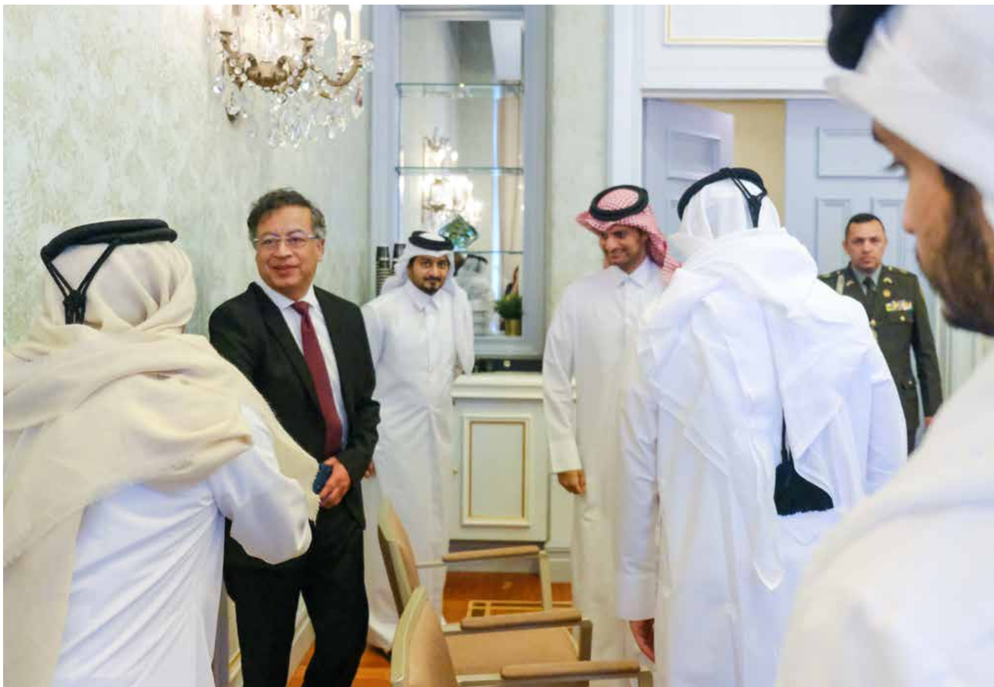
El presidente Petro, fue recibido en palacio por las autoridades de Qatar

E l presidente Gustavo Petro llegó a Doha (Qatar), proveniente de Dubái (Emiratos Árabes Unidos), donde participó en la Cumbre Mundial de Gobiernos.