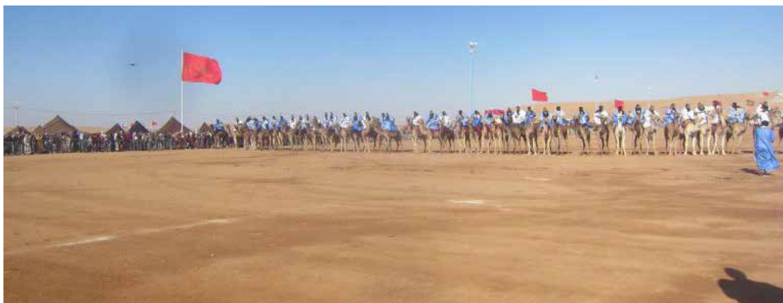
El festival de Moussem se lleva a cabo al pie de la tumba del jeque Mohamed Laghdaf, un héroe del desierto que luchó hasta su muerte, en 1960, por la independencia de Marruecos de Francia y España. Los nómadas veneran al jeque porque luchó por la libertad.

¡Asalaam Alekum! ¡Saludos desde el Sahara! , es el saludo de los grupos de nómadas de los cuales saludamos en varios kilómetros de recorrido. Todos llevan una sonrisa listos para disfrutar de un nuevo encuentro entre las diversos tribus. Llegan las fiestas para los habitantes del Sahara es hora de acabar con la tristeza y mirar con optimismo al frente pisando la fina arena que cubre millones de metros cuadrados de varios países