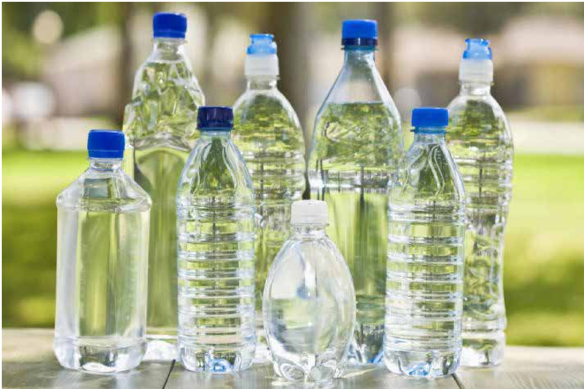
Beber un trago de esta botella que has estado usando toda la semana sin lavar podría ser el equivalente a lamer la taza del inodoro, dice la investigación.

hace sentir bien con nosotros mismos. Después de todo, es un plástico menos que lanzamos a la basura y contribuimos a la salvación del planeta.