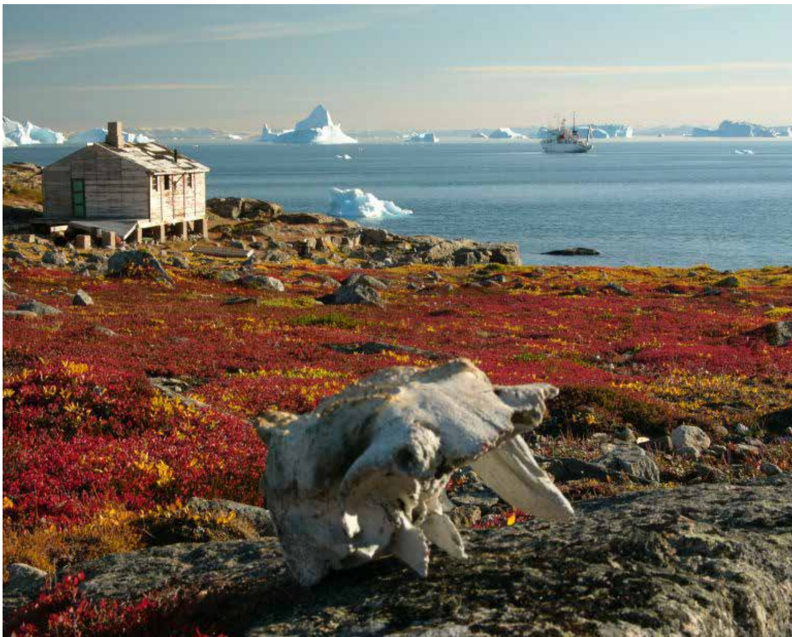
Todos los componentes de cualquier ser vivo

Organizaciones de células: Las bacterias se