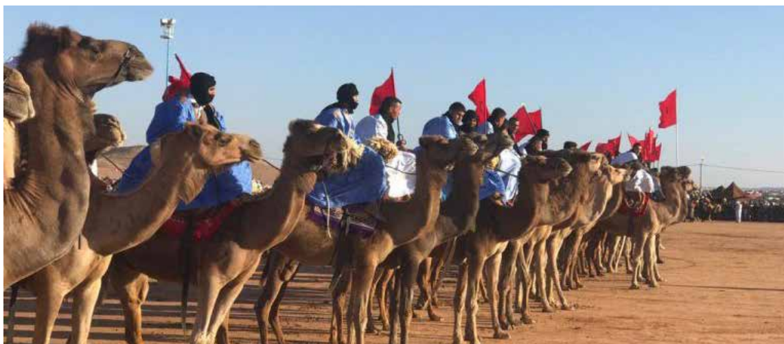
Tradicionalmente los camellos se marcan a fuego con la seña distintiva de cada cabila, reconocible para todo aquel que pudiera encontrar una res extraviada. La fácil domesticación del dromedario, llamado «Ymel» en el Sahara Occidental, y su resistencia al desierto han hecho de este animal el compañero perfecto del beduino saharauí, al que provee de carne, leche y cuero.

Una vez al año en Tan-Tan hay un espectáculo especial: las tribus nómadas del Sahara en una gigantesca ciudad de tiendas de