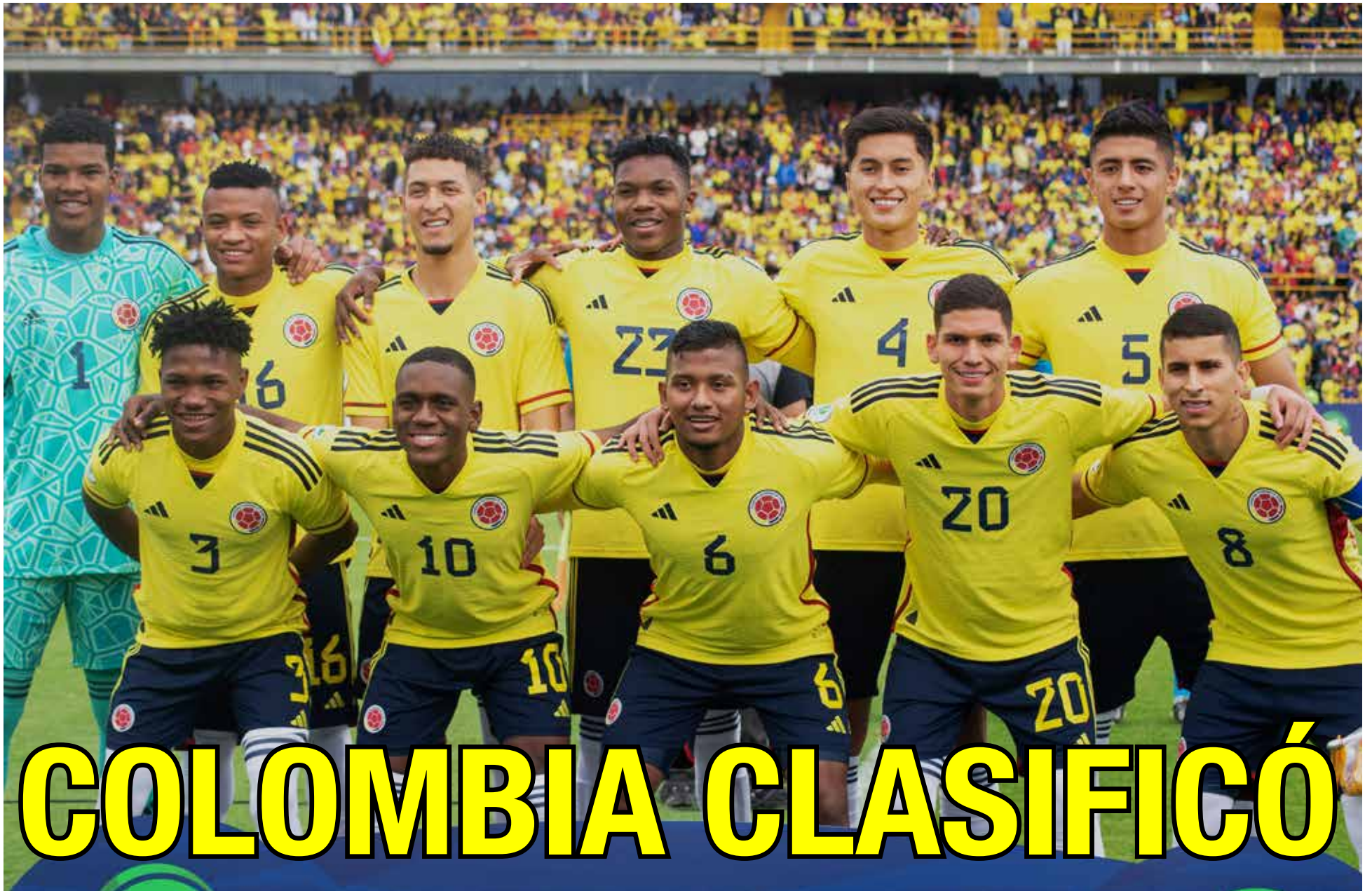
Colombia sacó tiquete al Mundial Sub-20 tras derrotar a Chile. La tricolor se metió al certamen global en la penúltima fecha del Sudamericano.