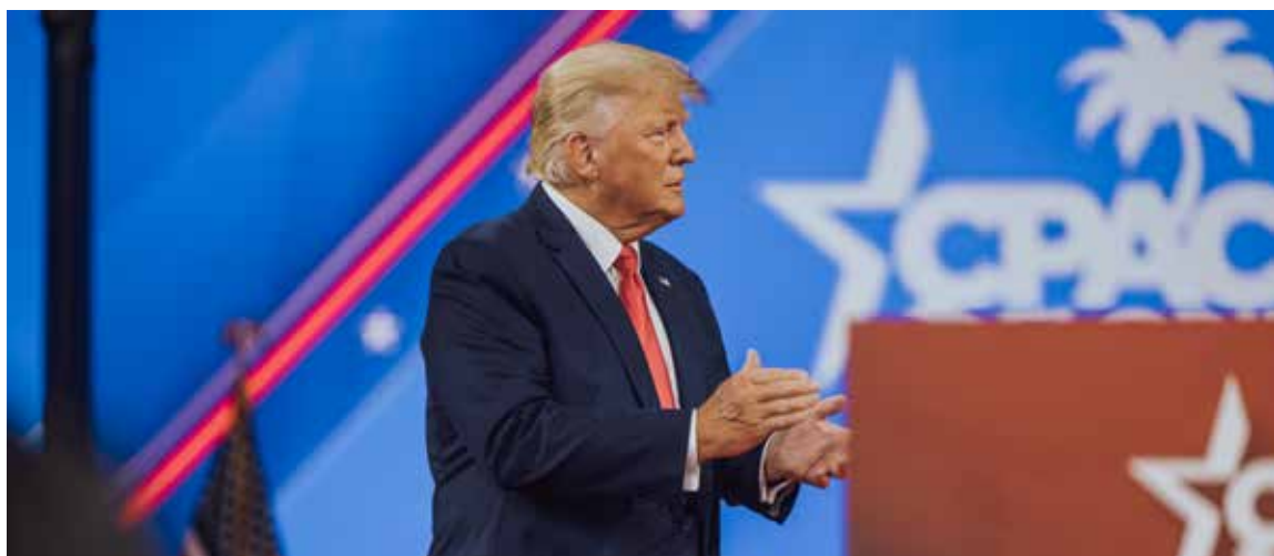
Donald Trump, presidente de los Estados Unidos

D onald Trump, en lo que lleva de su nueva presidencia, está destacando por su estilo de liderazgo directo y su enfoque en cumplir rápidamente con sus promesas de campaña. Su capacidad para tomar decisiones rápidas y contundentes, a menudo a través de órdenes ejecutivas, le ha permitido implementar cambios significativos en poco tiempo, reflejando su enfoque empresarial en la política.