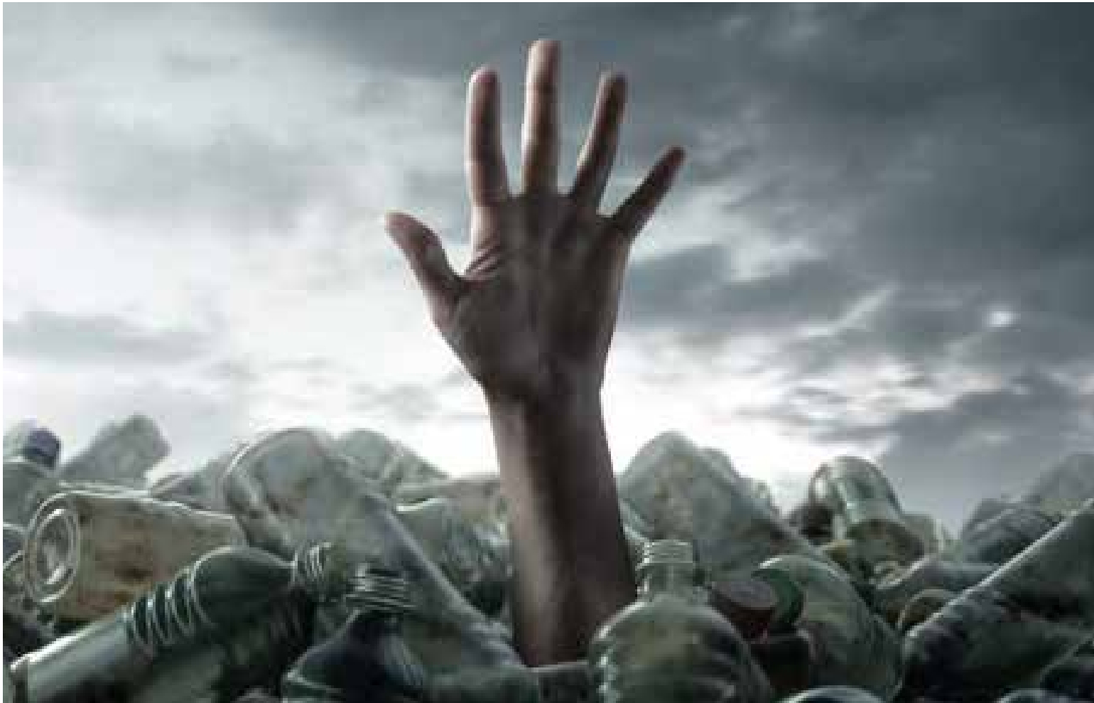
La tierra amenazada

La Tierra tiene alrededor de 4.500 millones de años. Nuestra especie humana, Homo sapiens, habita en ella desde hace poco más de 300.000 años (un 0,006 %, lo que se conoce como un instante geológico) y representa una ínfima parte de toda la biodiversidad, cuantificada en aproximadamente 10 millones de especies (algunas de ellas ni siquiera descubierta aún por la ciencia).